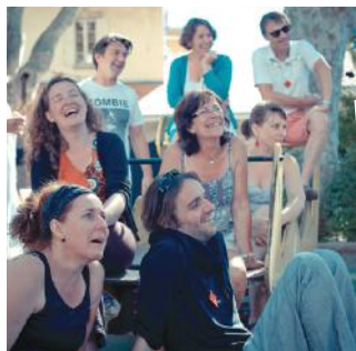
L'animation d'un réseau associatif

Nos compétences, ce que nous savons faire pour partager nos valeurs