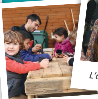
L'éducation pour tous